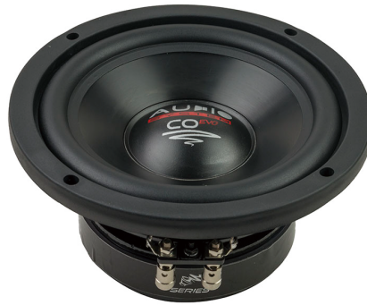
CO 06 DC